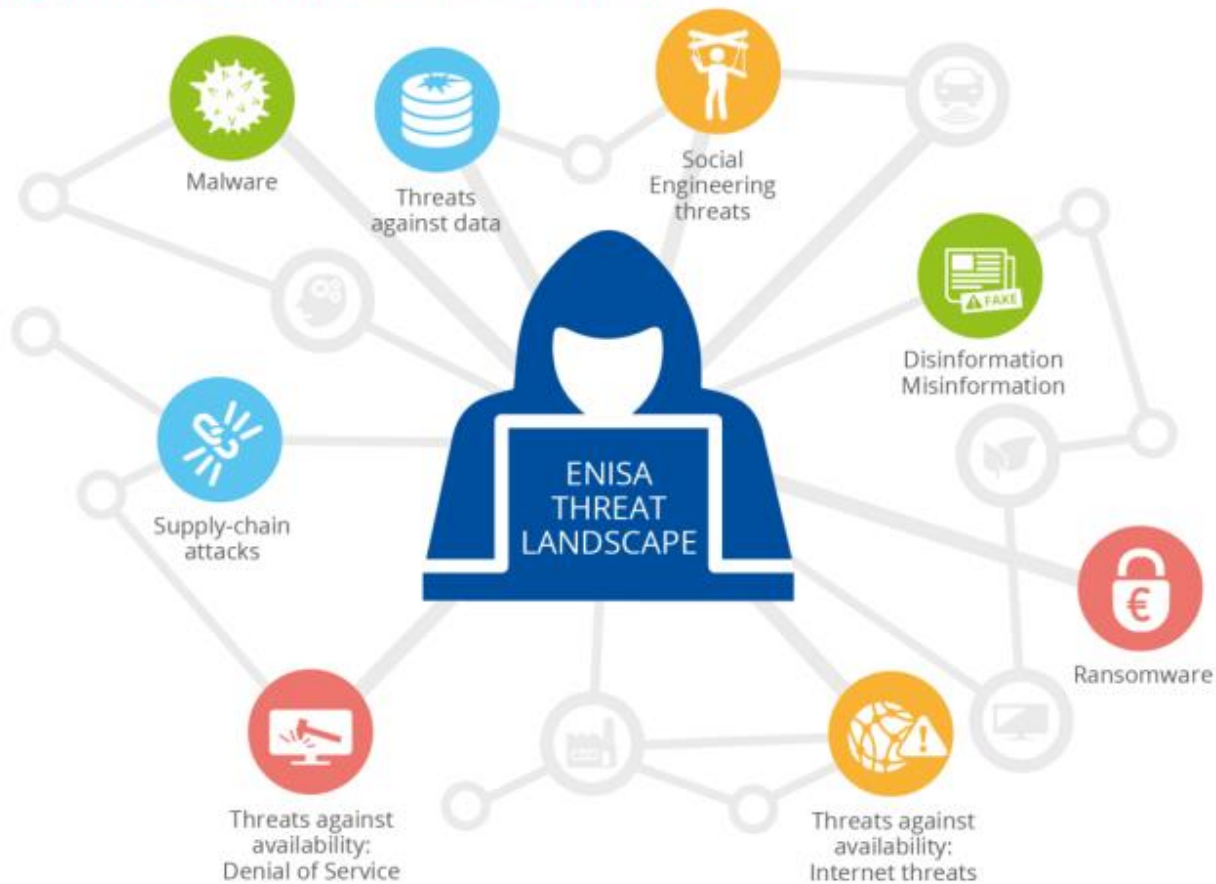
Figure 1: ENISA Threat Landscape 2022 - Prime threats